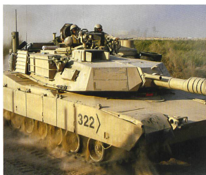
Der amerikanische Panzer Abrams.

Voraussetzung für das Aufeinanderprallen von T-90 und Abrams wäre indessen ein Schulterschluss von Russland und den Vereinigten Staaten im Kampf gegen den ISIS. Erst wenn sich die Präsidenten Obama und Putin auf ein gemeinsames Vorgehen gegen die Jihadisten einigen würden, könnte es zum direkten Duell von russisch und amerikanisch konstruierten