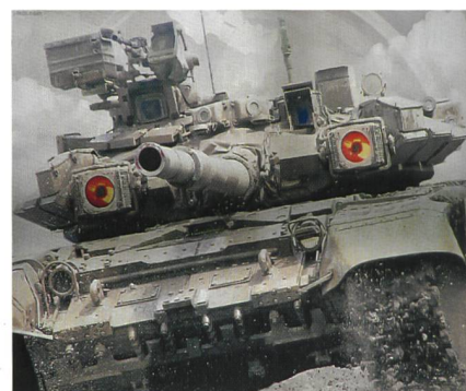
Russischer Kampfpanzer T-90.

rams nicht so gut wie die Russen den T-90. Besonders in der Verbandsausbildung sind sie weniger gründlich geschult wie die erfahrenen Russen. Überlegen wären die ISIS-Verbände in der Geländekenntnis.