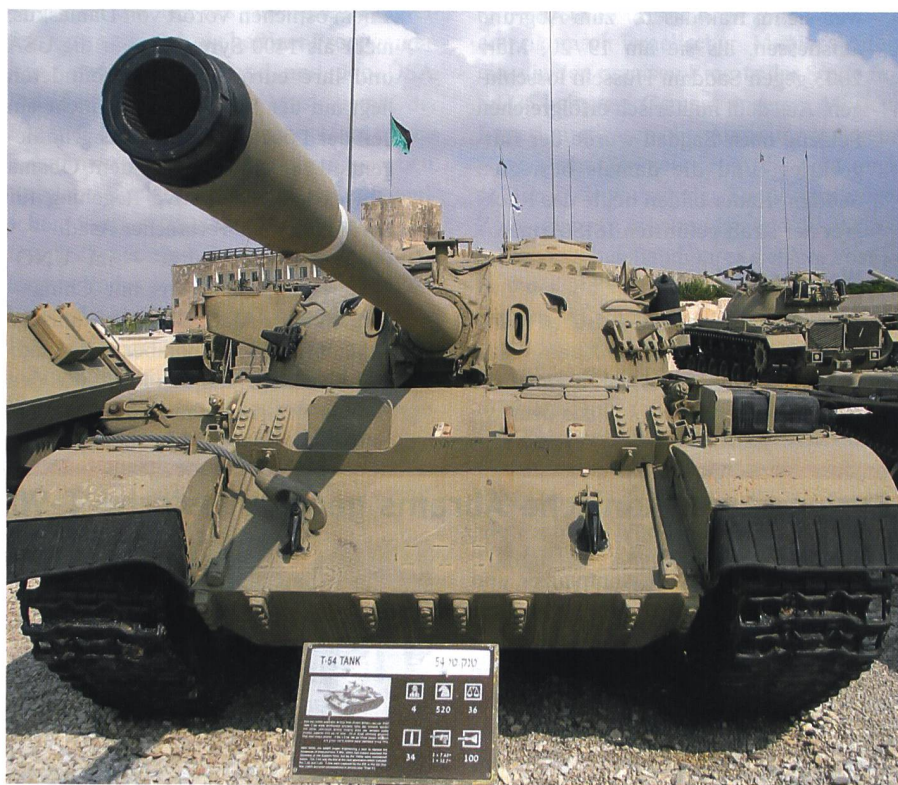
Israel erbeutete syrisches Material. Ein umgebauter T-54 in Latrun.