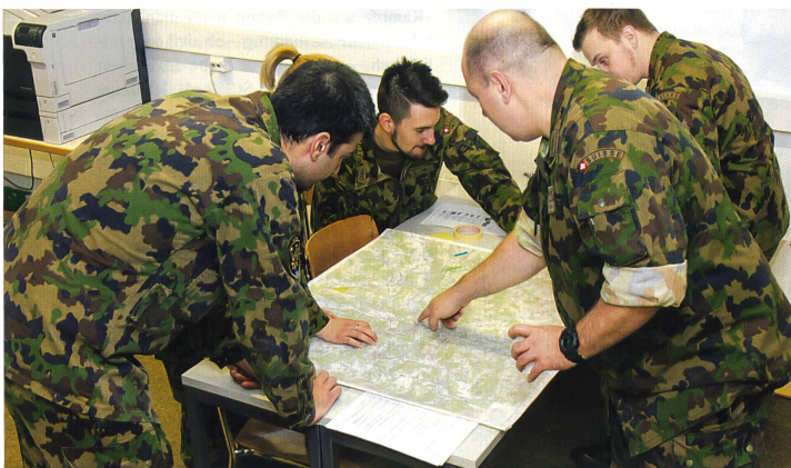
Viele Themen wurden in Form von Gruppenarbeiten bearbeitet.