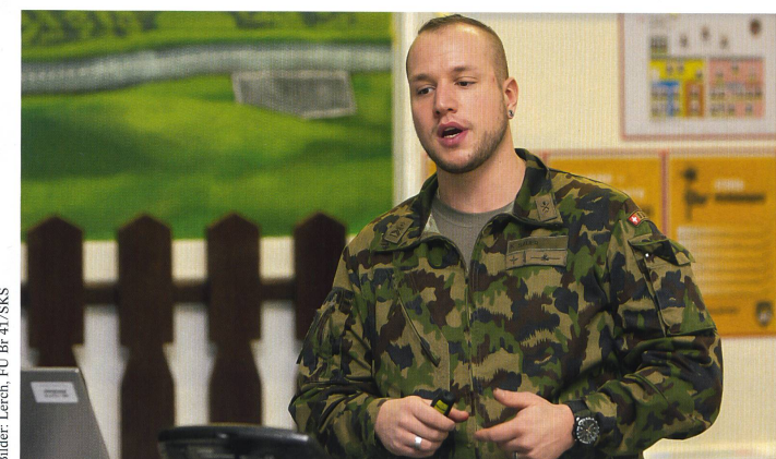
Für einen maximalen Lerneffekt wurden die Ergebnisse präsentiert und besprochen.