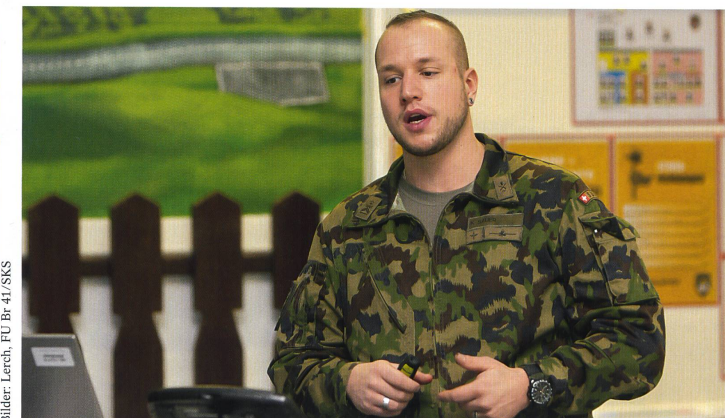
Für einen maximalen Lerneffekt wurden die Ergebnisse präsentiert und besprochen.