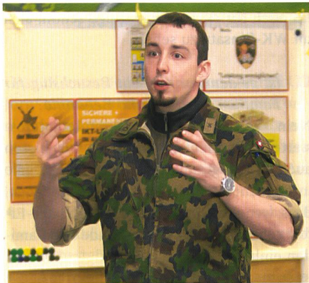
Jeder Teilnehmer erarbeitete Themen.

Der FDK für Einh Fw wird für die neu in der Brigade eingeteilten Feldweibel einmal pro Jahr weiterhin durchgeführt. Der nächste Kurs findet im Januar 2016 statt. Zusätzlich wird im März 2016 der zweite FDK für Stabsadj durchgeführt. Darüber hinaus ist ein FDK für Four angedacht. «Auch diskutieren wir Möglichkeiten, das Triumvirat , also Kp Kdt, Einh Fw und Four, zu stärken. Dies sind aber Projekte für die Zukunft», sagt Hptadj Blanc.