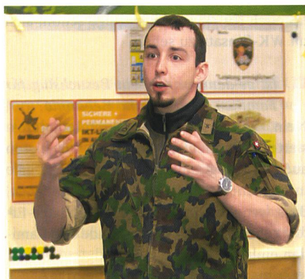
Jeder Teilnehmer erarbeitete Themen.

Der FDK für Einh Fw wird für die neu in der Brigade eingeteilten Feldweibel einmal pro Jahr weiterhin durchgeführt. Der nächste Kurs findet im Januar 2016 statt. Zusätzlich wird im März 2016 der zweite FDK für Stabsadj durchgeführt. Darüber hinaus ist ein FDK für Four angedacht. «Auch diskutieren wir Möglichkeiten, das Triumvirat , also Kp Kdt, Einh Fw und Four, zu stärken. Dies sind aber Projekte für die Zukunft», sagt Hptadj Blanc.