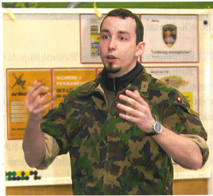
Jeder Teilnehmer erarbeitete Themen.

Der FDK für Einh Fw wird für die neu in der Brigade eingeteilten Feldweibel einmal pro Jahr weiterhin durchgeführt. Der nächste Kurs findet im Januar 2016 statt. Zusätzlich wird im März 2016 der zweite FDK für Stabsadj durchgeführt. Darüber hinaus ist ein FDK für Four angedacht. «Auch diskutieren wir Möglichkeiten, das Triumvirat , also Kp Kdt, Einh Fw und Four, zu stärken. Dies sind aber Projekte für die Zukunft», sagt Hptadj Blanc.