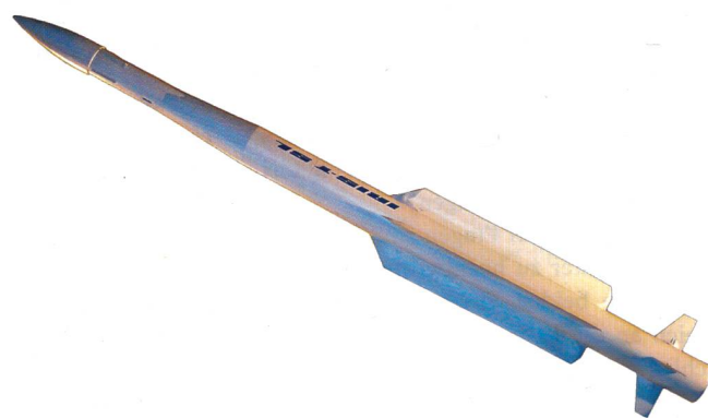
Diehl dagegen bietet die vielfach erprobte IRIS-T SL an.