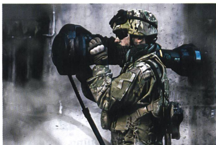
Abschuss einer Panzerabwehrrakete.

Die finnischen Streitkräfte beschaffen weitere Saab-Panzerabwehrhandwaffen. Sie bestellten für rund 32 Millionen Euro eine weitere Tranche der Next Generation Light Anti-tank Weapon (NLAW). Der Vertrag umfasst neben den Waffen auch Ausbildungsgeräte sowie Optionen für weitere Lieferungen. Das ursprünglich für Grossbritannien entwickelte schultergestützte Panzerabwehrraketensystem NLAW hat