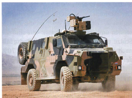
THALES Bushmaster mit fernbedienter Waffenstation für die Niederlande.

Die Niederlande haben bei THALES Australien zwölf neue geschützte Fahrzeuge des Typs Bushmaster bestellt. Die Fahrzeuge sollen in der Variante Truppentransporter ausgeliefert werden und verfügen über eine zusätzliche Kompositpanzerung, fernge-