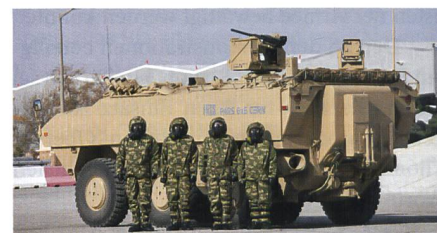
ABC-Aufklärungsfahrzeug Pars von FNSS.

Das türkische Rüstungsunternehmen FNSS Savunma Sistemleri hat neue Varianten der gepanzerten Radfahrzeugfamilie Pars vorgestellt. Auf dem 6×6-Laufwerk wurde ein ABC-Aufklärungsfahrzeug mit Sensoren und Analysegeräten für die Detektion und Identifikation chemischer Kampfstoffe, toxischer Industriechemikalien und biologi-