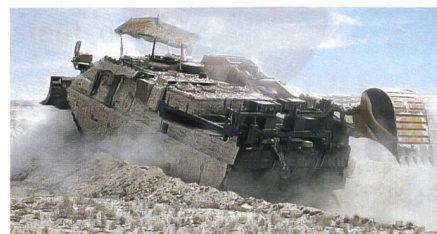
Bergepanzer WiSENT 2 im Einsatz.

Die norwegische Beschaffungsbehörde hat sechs WiSENT 2 Bergepanzer bei der FFG Flensburger Fahrzeugbau Gesellschaft mbH zur Auslieferung ab 2017 bestellt. Die Bestel-