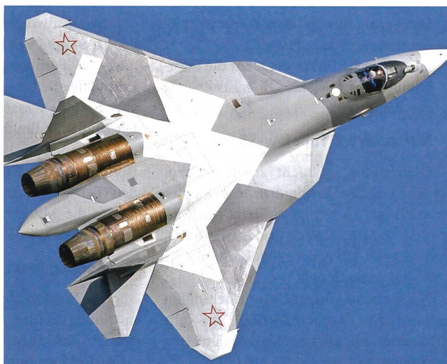
Suchoi T-50: Die Antwort der russischen Luftwaffe auf den F-22.

Den beiden Kampfflugzeugen der 5. Generation, dem amerikanischen F-22 Raptor und dem russischen Suchoi T-50, ist eines gemeinsam: Beide Entwicklungen wurden immer wieder aus finanziellen Gründen verzögert; und beide Maschinen werden zumindest nach dem jetzigen Planungsstand nicht in grosser Stückzahl gebaut.