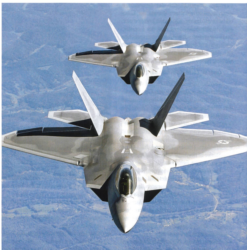
Der F-22 Raptor ist das teuerste Jagdflugzeug in der Geschichte der US Air Force.

Den eigentlichen Befehl erteilt General Lloyd J. Austin III, der Kommandant des Central Command . Präsident Obamas Befehl lautet, der Islamische Staat sei in