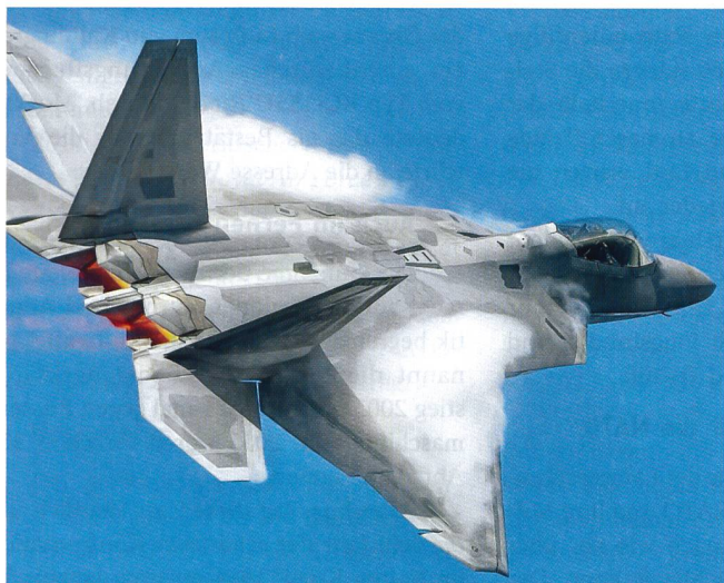
F-22 Raptor: Eine amerikanische Maschine der 5. Generation.