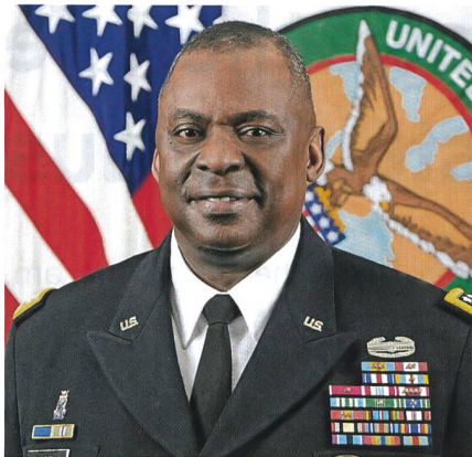
General Llyod J. Austin III, Kdt Centcom.