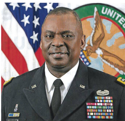
General Lloyd J. Austin III, Kdt Centcom.