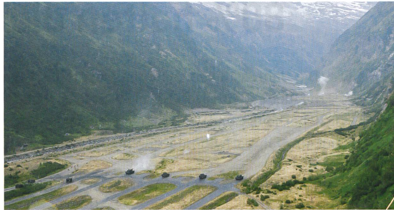
Ein Schützenpanzer und vier Panzer kämpfen sich nach vorn.

satz – auch auf dem Schiessplatz – unumgänglich ist. Somit werden Sie vermutlich in Zukunft vermehrt auch Schützenpanzer 2000 auf diesem Platz sehen.»