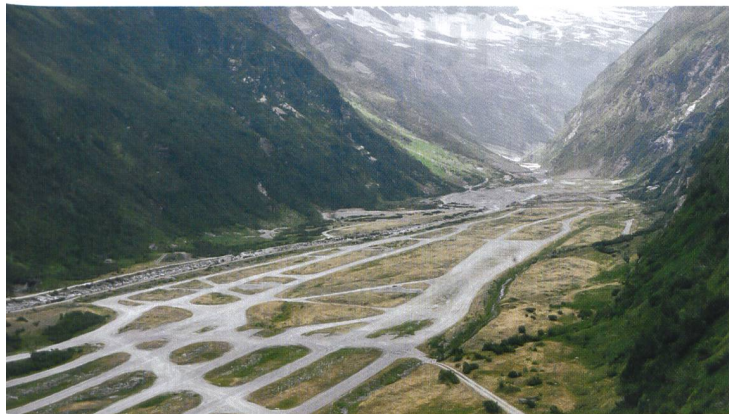
Der Schiessplatz Hinterrhein von oben.