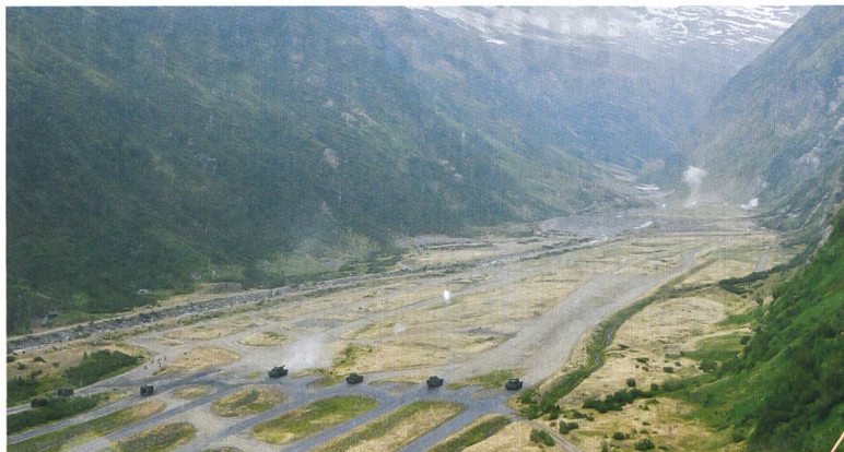
Ein Schützenpanzer und vier Panzer kämpfen sich nach vorn.

satz – auch auf dem Schiessplatz – unumgänglich ist. Somit werden Sie vermutlich in Zukunft vermehrt auch Schützenpanzer 2000 auf diesem Platz sehen.»