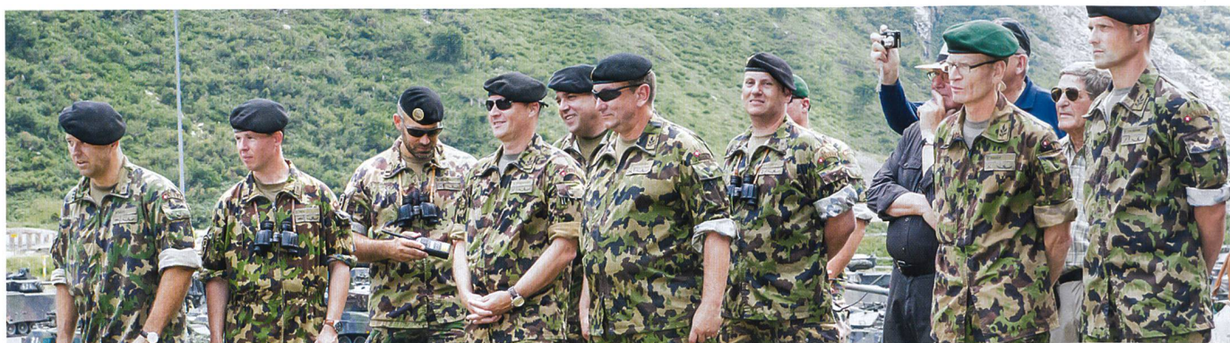
Sachkundige Experten beobachten genau die Vorführung zum Jubiläum.

Wellinger: «Ich persönlich bin dezidiert der Meinung, dass der gemischte Ein-