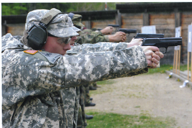
Der Posten «Pistoleros» verlangte nach einer ruhigen Hand.