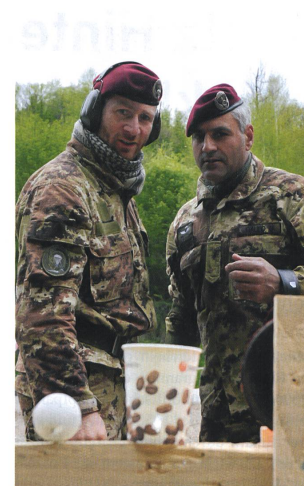
Der Posten «Different Targets», wo das korrekte Einschiessen zu den gewünschten Treffern führte.