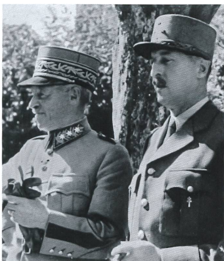
Am 13. Juni 1945 erfolgte der Schweizer Gegenbesuch in Konstanz. Die Generäle Guisan und König in der Grenzstadt.