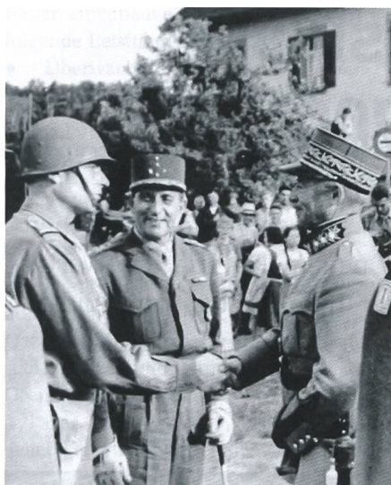
Festlicher Empfang am 18. Mai 1945: Die Generäle de Lattre de Tassigny und Guisan mitten in Stein am Rhein.