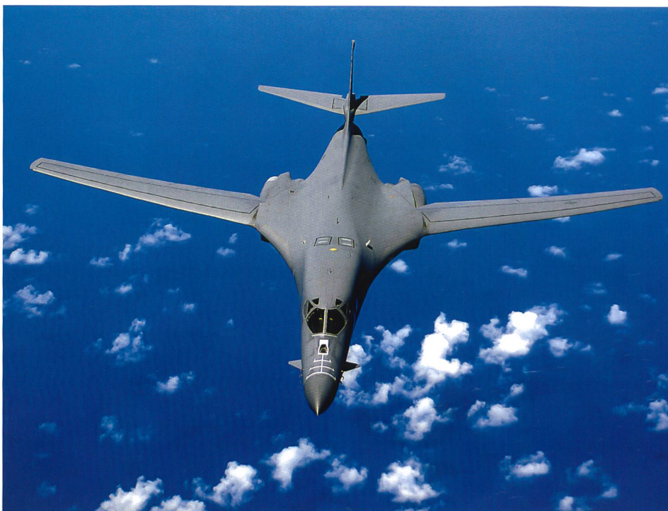
Im Oktober 2015 unterstellt die amer. Luftwaffe ihre Rockwell-Boeing-Lancer neu.

Ihr erster Kommandant war Generalmajor Carl Spaatz, der später als einziger General bei den Kapitulationen Deutschlands, Italiens und Japans dabei war. Im Zweiten Weltkrieg setzte Spaatz 200 000 Mann, 2000 schwere Bomber und 1000