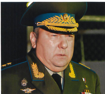
General Wladimir Schamanow, Kommandant der russischen Luftlandtruppen.