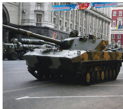
Der russische Luftlandepanzer Sprut mit der 125-mm-Glattröhrkanone.