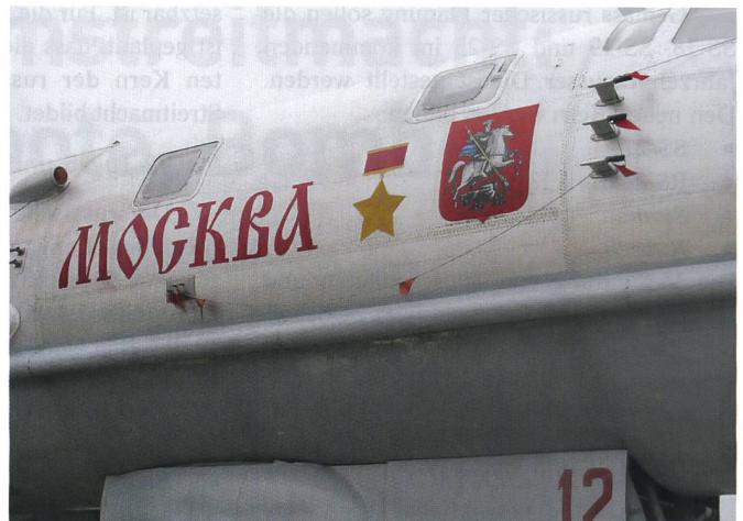
Auch der noch ältere Langstreckenbomber Tu-95 wird jeweils auf einem grossen Flugfeld ausgestellt. Die Maschine trägt den Namen der russischen Hauptstadt Moskau. Wie der Bomber T-160 werden die noch 62 Tu-95 auch atomar bewaffnet.

im kommenden Jahrzehnt die schwere Spitze der russischen Atomstreitmacht dar. Sie kann auf verschiedenen Flugbahnen eingesetzt werden und wird mit Spezialsystemen ausgestattet.