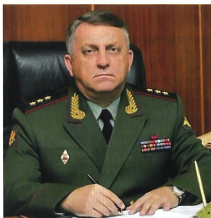
Generaloberst Sergei Karakayew, geb. 1961, Kdt der Strategischen Raketen-Streitkräfte. Raketeningenieur. Durchlief alle Kdo-Stufen vom Einheitschef bis zum Streitkräfte-Kdt (ab 22. Juni 2010).

Russlands Rüstung hat direkte Auswirkungen auf Europa. Unter dem Titel Looming Air Defence Priorities in Eastern Europe findet in Warschau vom 28. bis zum 30. Juli 2015 ein hochkarätig besetztes Symposium statt.