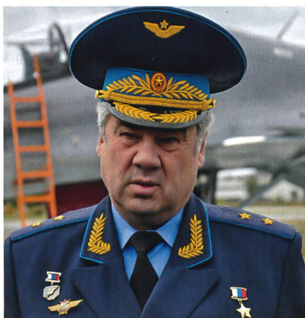
General Viktor Bondarev, Kdt der russischen Luftwaffe. Kämpfte in Afghanistan und in beiden Tschetschenien-Kriegen. 2000 Held der Russischen Föderation, seit 6. Mai 2012 Kommandant Luftwaffe.