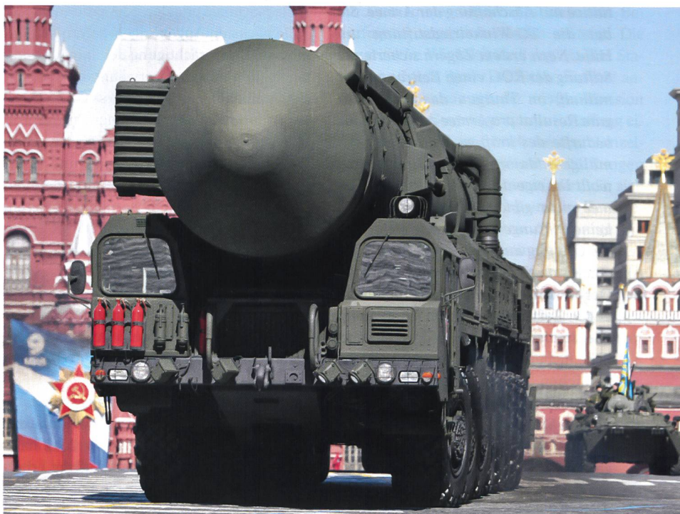
Jedes Jahr wird am 9. Mai die Atomstreitmacht auf dem Roten Platz vorgeführt.