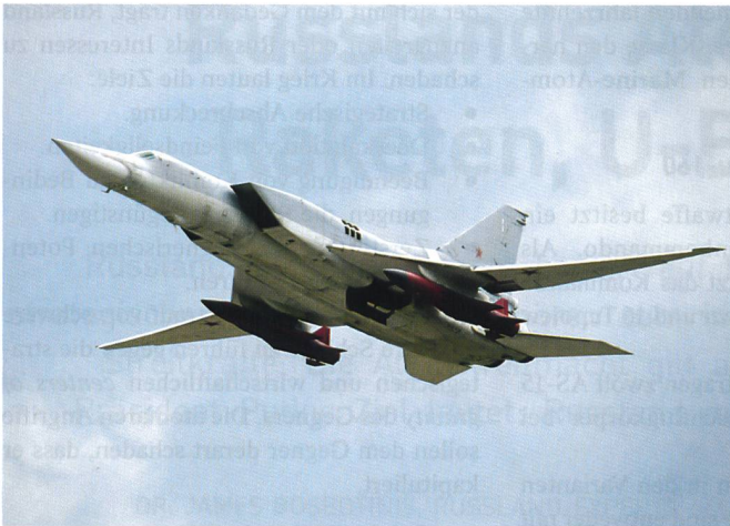
Bomber Tupolew-22M3 mit zwei Atombomben. Die jetzt 40 (von total 115) operationellen Tu-22M3-Bomber bilden derzeit mit den 62 einsetzbaren Tupolew-95 und den 16 noch vorhandenen Tupolew-160 das Rückgrat der russischen Bomberflotte.