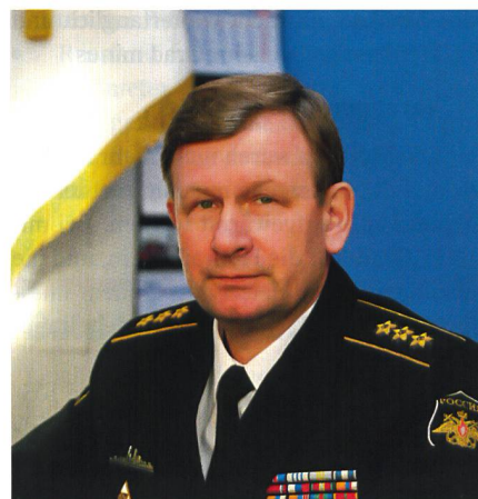
Admiral Viktor Chirkov, Kdt der russischen Marine. Führt die Fregatte Storozhevoy , den Zerstörer Admiral Spiridonov , die Primorskiy-Flotte und die Baltische Flotte . Im Amt seit 6. Mai 2012.