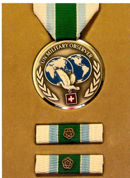
Die Medaille für UNO-Militärbeobachter.