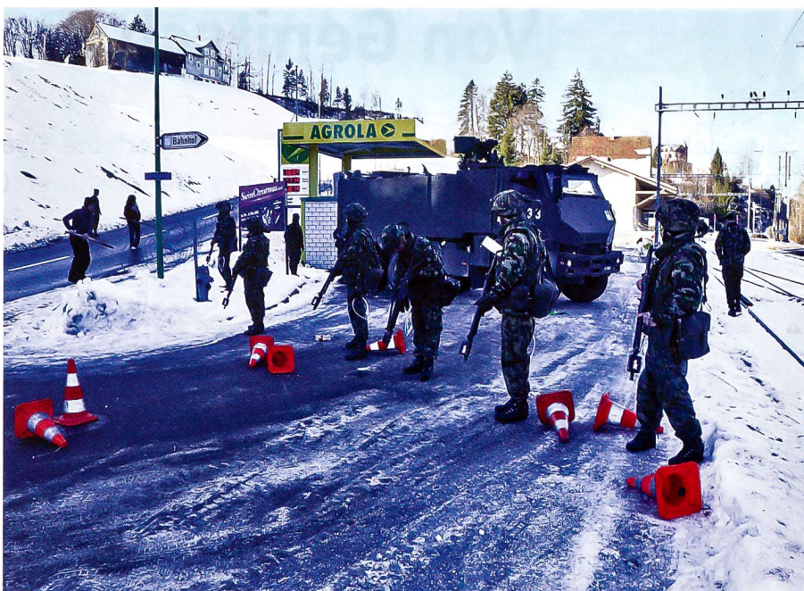
Das wetterharte GMTF im strengen Wintereinsatz beim St. Galler Geb Inf Bat 77.

Zusammenfassend lässt sich festhalten, dass die Einführung der Duro III/P in das Geb Inf Bat 77 erfolgreich und problemlos erfolgte. Der Ausbildungsstoff im Einführungskurs in Thun war gewiss sehr umfangreich und das Programm für die beschränkte Zeit entsprechend gedrängt.