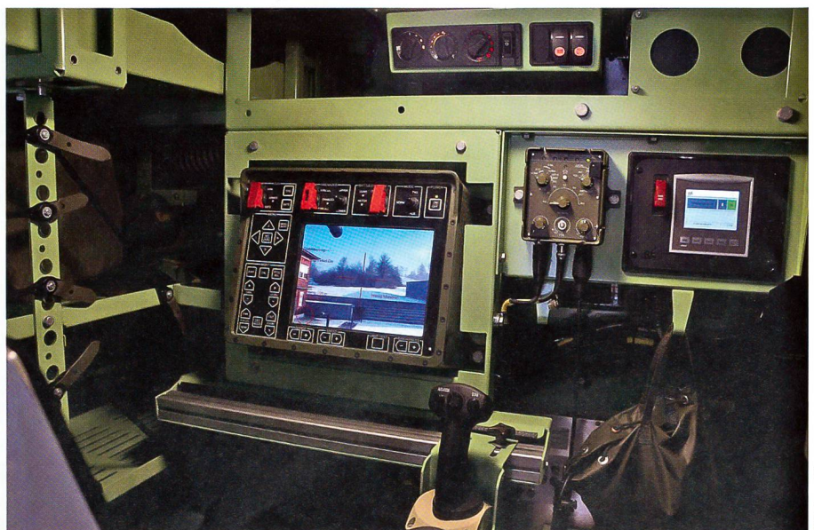
Blick in das Innere des neuen Geschützten Mannschafts-Transportfahrzeugs GMTF.

Anschliessend folgten die korrekte Wartung und Funktionskontrolle von Turm und Waffe sowie der Grossparkdienst an