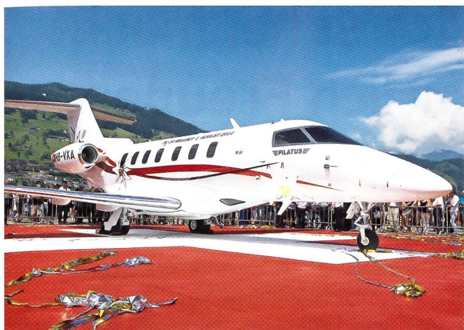
Von Zehntausenden bestaunt: Der neue PC-24-Jet von Pilatus.