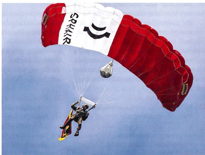
Fallschirmspringer brachten die Kantonsfahnen vom Himmel.