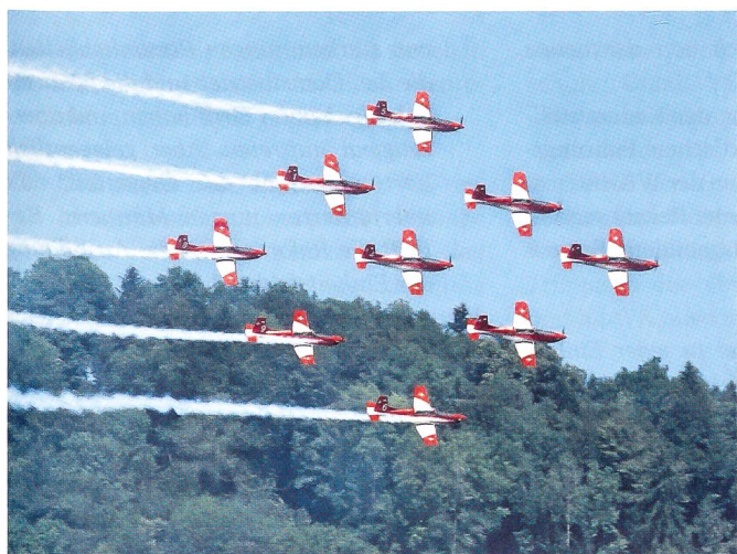
Neun PC-7 der PC-7-Staffel zeigten ein Superprogramm.