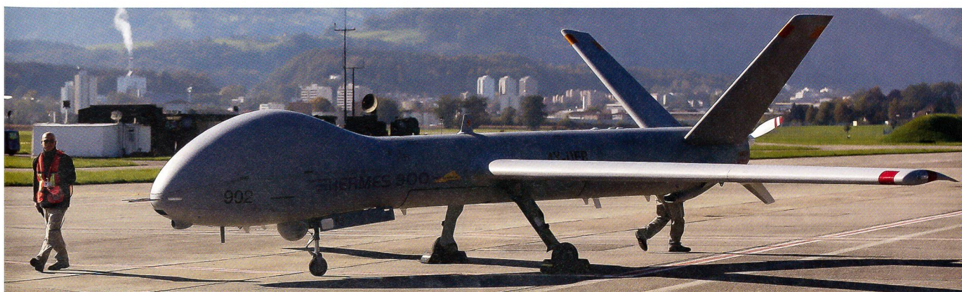
Die israelische Aufklärungsdrohne Hermes 900 von Elbit bei der Evaluation in der Schweiz. Geplant sind sechs solche Drohnen.