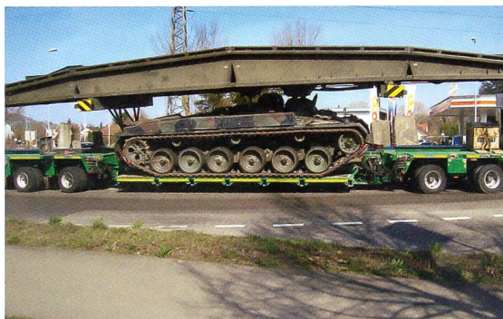
Der Brückenpanzer 68/88, eindeutig ein Panzer.