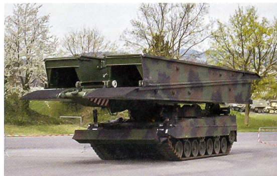
Neuer Brückenpanzer, pardon: Brückenlegesystem.