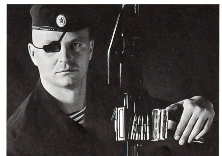
Speznas mit falschem Namen: Wiktor.

Allein die Nennung der Shajetet 13 , der Kampfschwimmertruppe der israelischen Marine, zeigt, wie willkürlich die Rangliste ist. Weshalb fehlt die ebenbürtige Sayeret Matkal , die Speerspitze des Generalstabs?