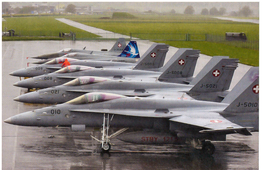
Bereit für den Einsatz ab Buochs, vier F/A-18 Hornet und zwei F-5E Tiger.