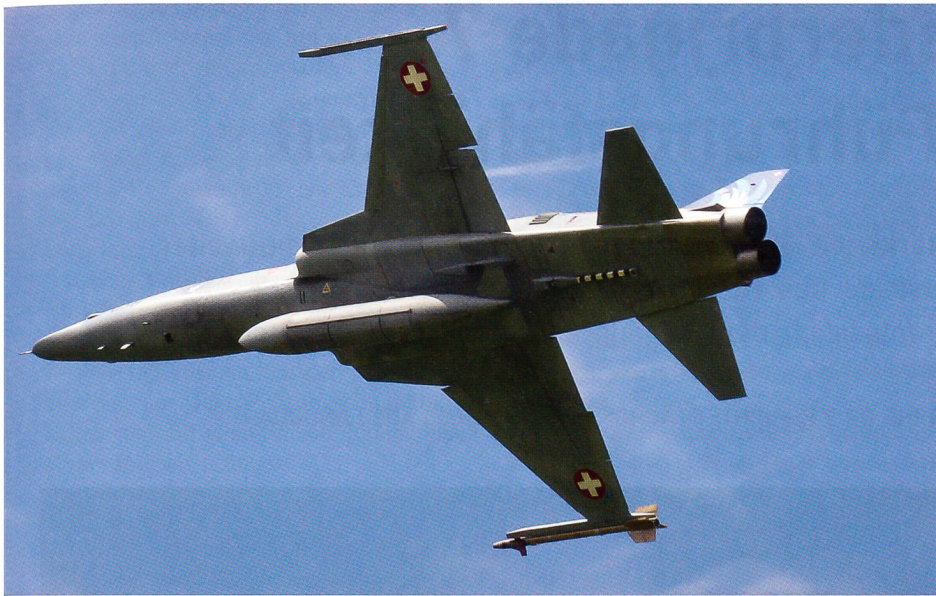
Ein Tiger kommt von einer Mission nach Buochs zurück.