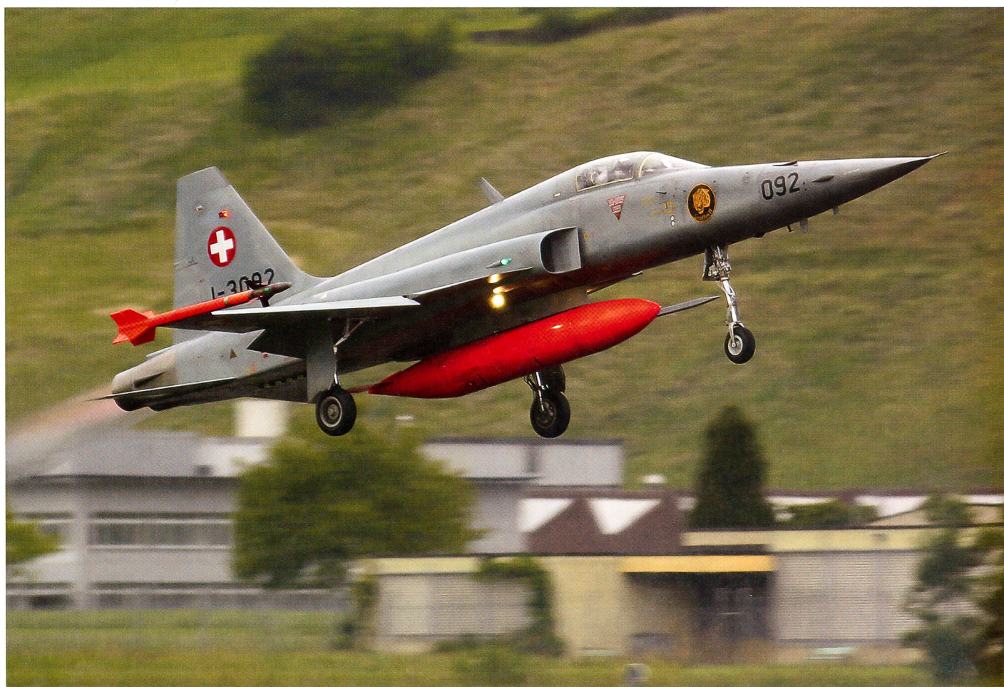
Ein Tiger F-5E startet anlässlich der Übung «REVITA» 2014 auf dem Flugplatz Buochs.