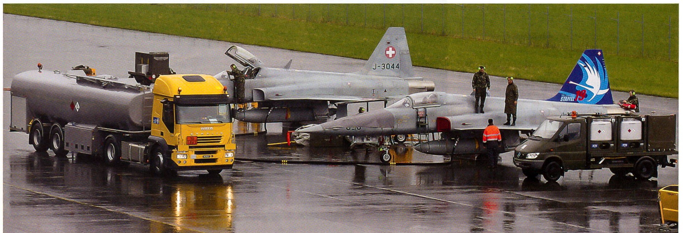
Die Bodencrew des Flpl Kdo 13 aus Meiringen ist bei strömendem Regen in Buochs an der Arbeit.