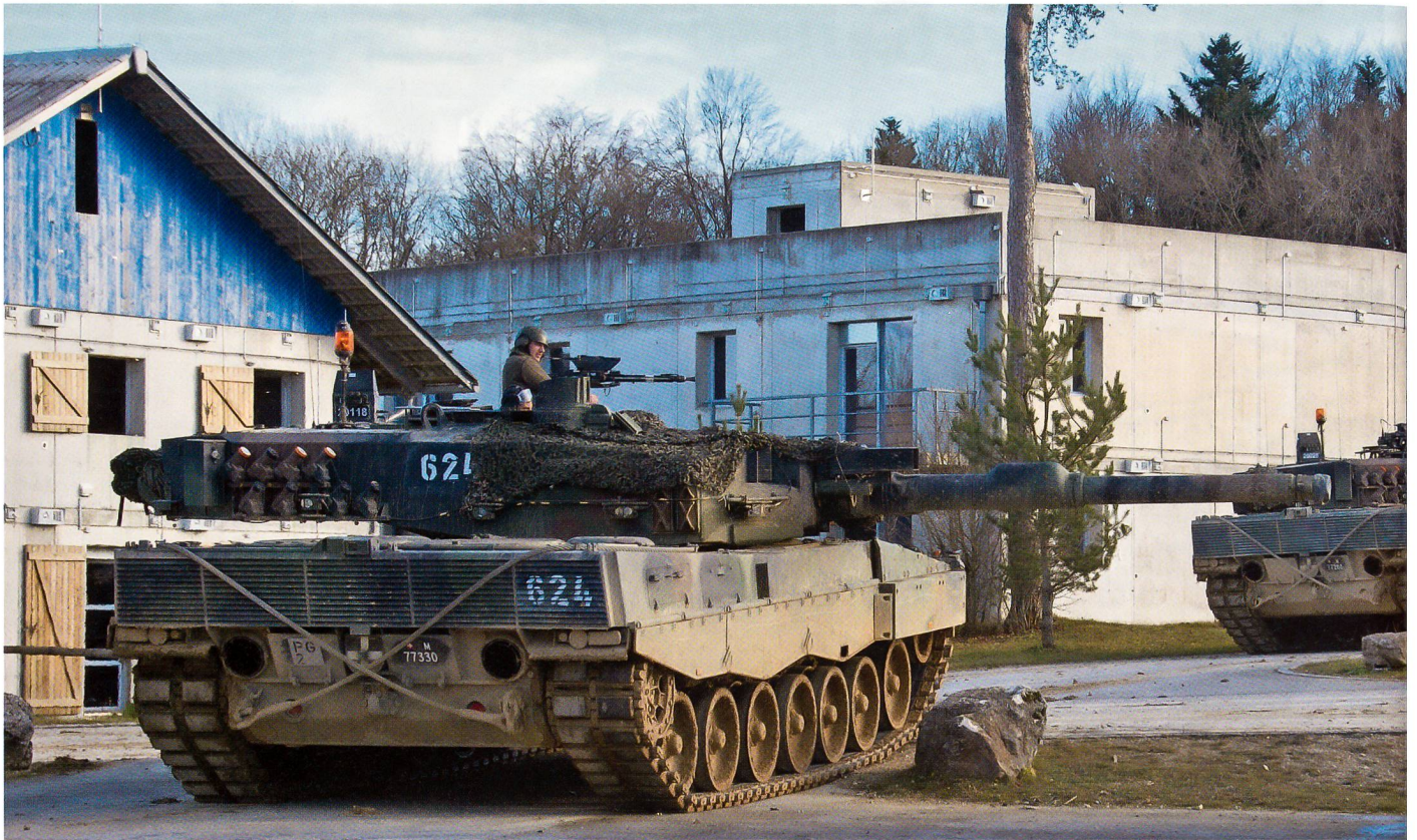
Panzer 87 Leopard WE eingesetzt im Nalé (Bure).

griffes der eigenen Truppen zu machen. Analoges gilt für den Schiesskommandanten. Dieser muss insbesondere das Feuer aller Bogenschusswaffen (inklusive der zu beschaffenden [Panzer-]Minenwerfer) sowie auch das Feuer zugunsten der Bodenverbände aus der Luft (Close Air Support) ins Ziel lenken sowie koordinieren können.