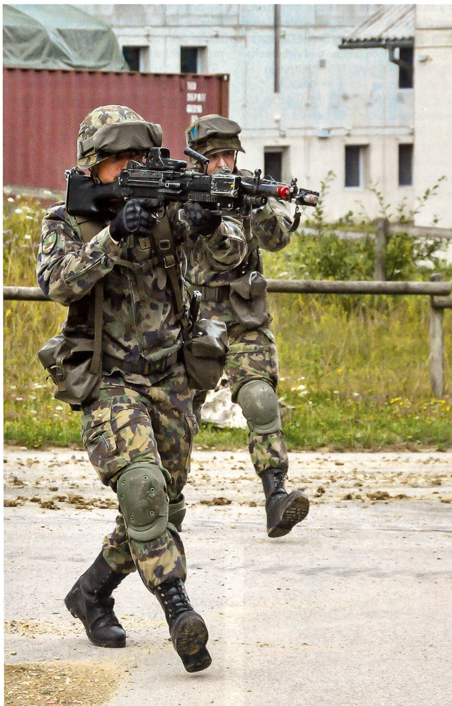
Panzergranadiere im Häuser- und Ortskampf.