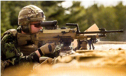
Neue MGs des Typs M60 für Dänemark.

Die bisher mit MG M/62 (alias Rheinmetall MG3) ausgestatteten dänischen