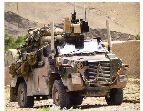
Geschütztes Fahrzeug Bushmaster für die jamaikanische Armee.

Thales Australia liefert zwölf geschützte Truppentransporter Bushmaster an die Streitkräfte in Jamaika. Die Fahrzeuge werden mit dem Kommunikationssystem Thales SOTAS M2 ausgestattet. Die Ausliefe-