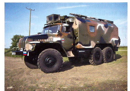
Geländelastwagen Ural-4320 als Basis für das geschützte Fahrzeug Federal-M.

Als Varianten sind im Wesentlichen Fahrzeuge mit kurzer und langer Fahrerkabine für Personentransport, Cargo und Sanitätsaufgaben vorgesehen. Mit etwa 16