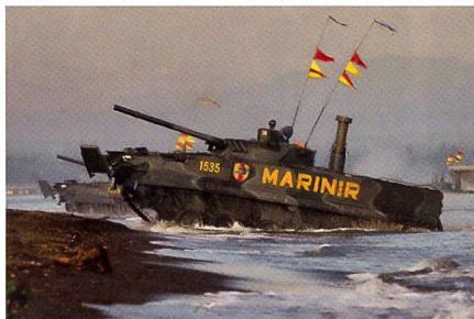
Amphibischer Schützenpanzer BMP-3F der indonesischen Marine.

Rosoboronexport hat den indonesischen Streitkräften 37 amphibische Schützenpanzer des Typs BMP-3F übergeben, die im Mai 2013 für 85 Millionen Euro bestellt worden waren. Indonesien verfügt jetzt über 54 BMP-3F, die von Marineeinheiten, Grenz- und Küstenschutzkräften genutzt werden sollen. Die Fahrzeuge mit einer dreiköpfigen Besatzung können bis zu sieben Einsatzkräfte transportieren und sind mit einer 100-mm-Panzer-, einer 30-mm-Maschinenkanone, Lenkflugkörpern und