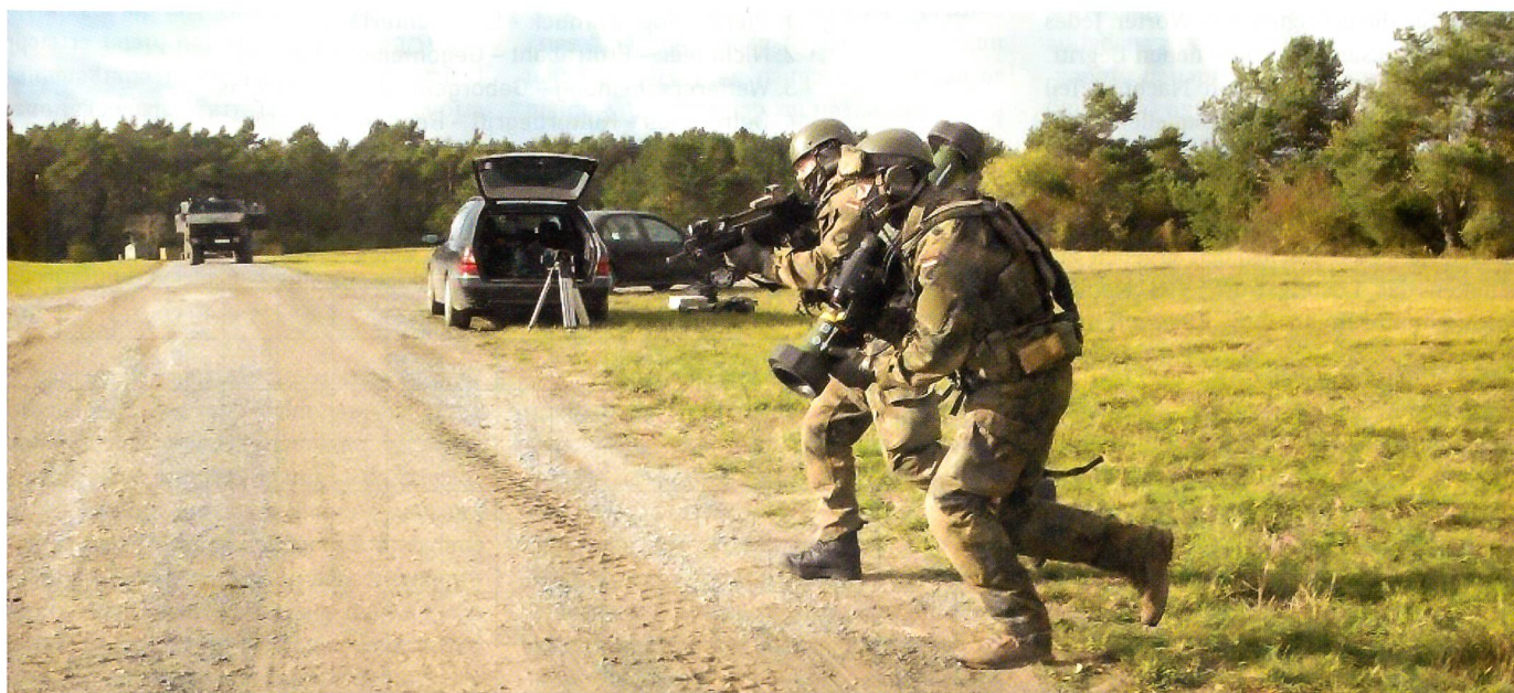
Ein Trupp wechselt die Stellung mit dem schultergestützten RGW 90, das eine Reichweite von 1200 Metern hat.

Es geht dabei um eine Technik zur Unterdrückung von Bränden mit Hilfe von Detektoren und nicht giftigen Aerosolen, die einen vorbeugenden und automatisierten Einsatz ermöglichen. Man hofft, bald die Zulassung für die Bundeswehr zu erhalten. ■