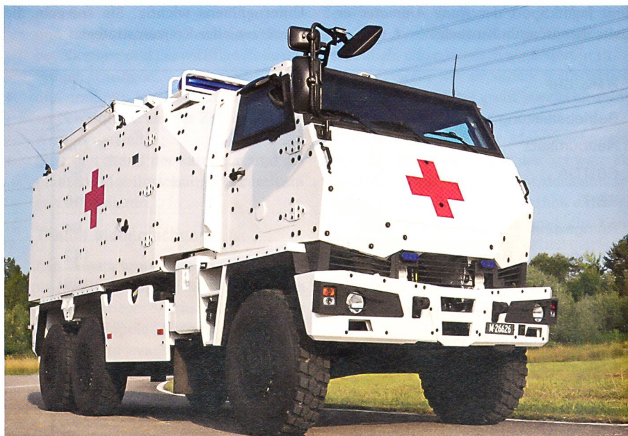
Das Geschützte Sanitätsfahrzeug (GSANF), ein DUR0, wurde in der Armee eingeführt.