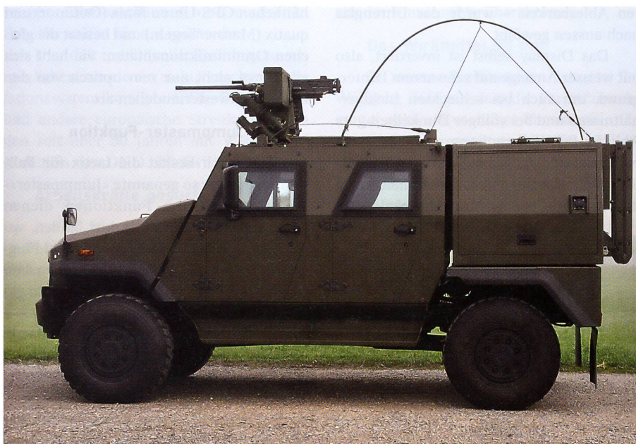
Der EAGLE EOR (Explosive Ordnance Reconnaissance) ist bei KAMIR schon im Einsatz.

Um die Einsatzbereitschaft und den Schutz der Soldaten zu maximieren, sind sämtliche Fahrzeuge mit einer Klimaanlage und einer ABC-Schutzbelüftungsanlage ausgestattet.