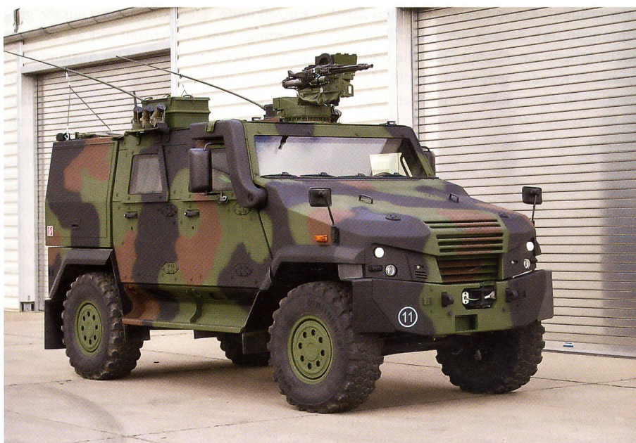
Für die Bundeswehr liefert Mowag dank einem neuen Vertrag weitere 76 EAGLE V.

Dank beachtlicher Nutzlastreserven und dank modularer Rüstsätze können die hochgeschützten Führungsfahrzeuge für unterschiedliche Missionen konfiguriert