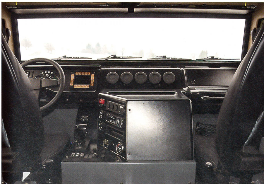
Der Blick in den modern und übersichtlich gestalteten Innenraum des Mowag EAGLE.

Ebenfalls von der Firma Mowag kommen die Fahrzeuge der DURO-Familie. Oft genannt und gezeigt wird seit einiger Zeit das bullige Geschützte Mannschaftstransportfahrzeug GMTF der Schweizer Armee. Bekannt ist auch das Geschützte Sanitätsfahrzeug GSANF, ebenfalls im Einsatz mit der Schweizer Armee.