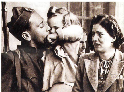
Familienabschied (aus «Sie und Er»).