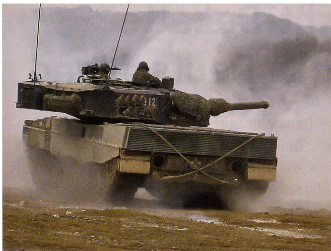
Der Kampfpanzer Leopard der Schweizer Armee in Bure.