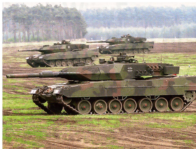
Drei Kampfpanzer Leopard der deutschen Bundeswehr.

Wir reden nicht von Umzügen von 50 Kilometern, sondern teilweise von 800 oder 900 Kilometern in einen völlig anderen Landstrich Deutschlands. Auch die Einsatzfähigkeit kann zur Belastung werden. Vor allem Leute, die eine spezielle Ausbildung haben, also eine, die in der Bundeswehr wenig verbreitet ist, werden häufiger belastet, in Einsätze gehen zu müssen, als jene, die über eine häufig vorhandene Ausbildung verfügen.