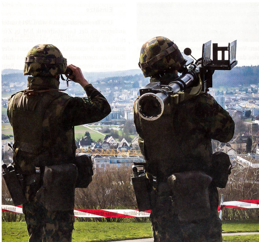
Ein Stinger-Trupp beim Einsatz der L Flab Lw.

Nach der Verschiebung auf eine Anhöhe im Raume Lenzburg besuchten wir eine Rapier-Stellung. Diese war so ausgewählt, dass die Waffen einen optimalen Wirkungsraum hatten – hier hat der Kdt