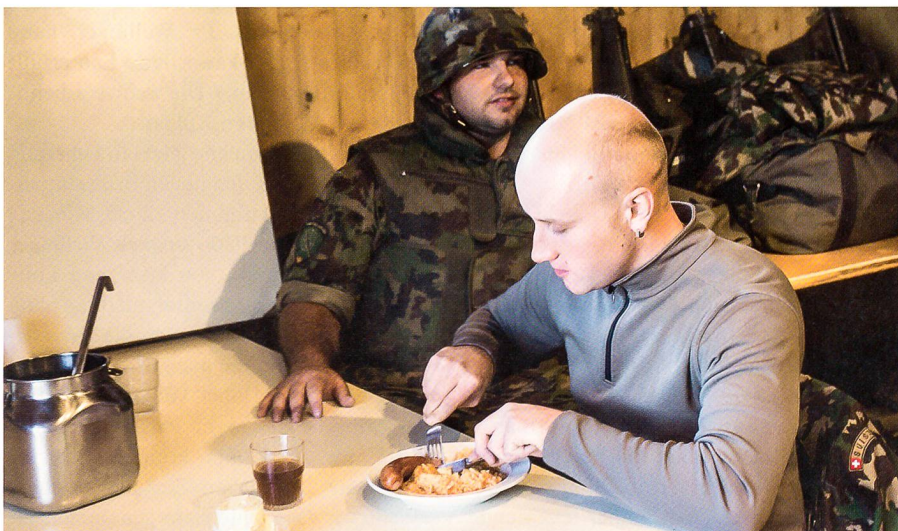
En Guete! Eine feine Wurst für die Truppe in der Unterkunft.