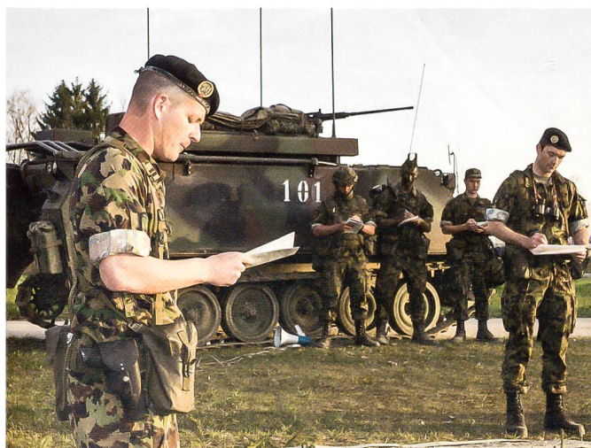
Das Panzersappeurbataillon 11 gehört zur Panzerbrigade 11 und zeigte erneut sein militärisches Wissen und Können.