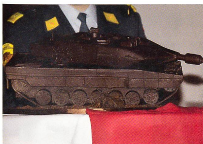
Massstabgetreu: Der Schoggi-Panzer.

Die OG Panzer wäre nicht die OG Panzer, warte sie nicht jedes Jahr mit einer Überraschung auf.