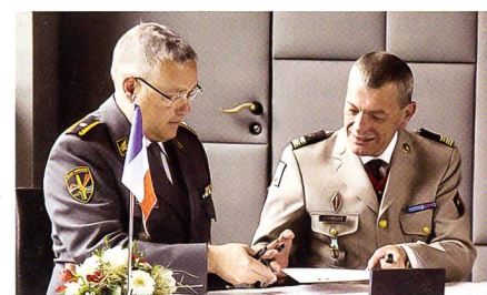
Die SOG unterzeichnet mit Oberst Vitrolles eine Milizkooperation mit Frankreich.