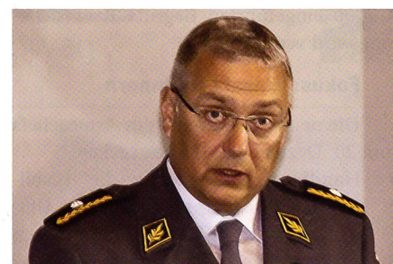
Froidevaux: «Die SOG zieht rote Linien.»