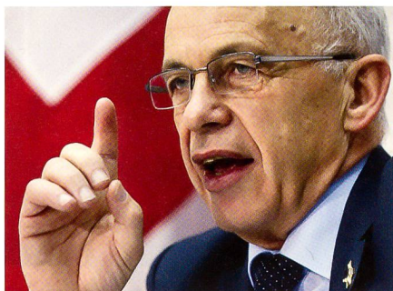
Ueli Maurer: Vorwürfe sind zynisch.

Wir leiden an hohen Betriebskosten, und selbst mit dem neuen Armeeplafond