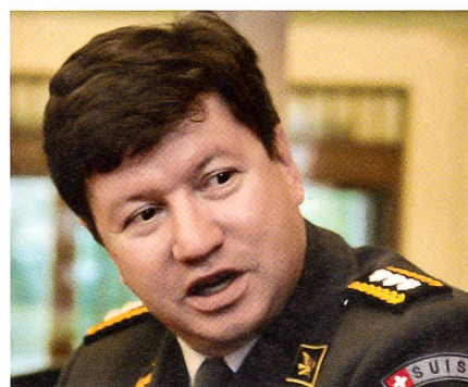
Schellenberg: Patrouille erhält F/A-18.