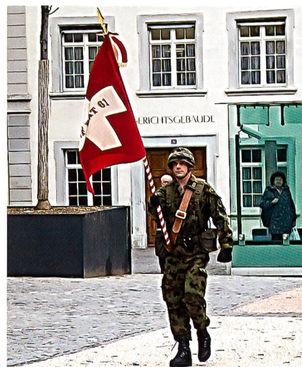
So soll es sein: Der Fähnrich des Inf Bat 61 korrekt bei der Fahnenabgabe.

Segmüller: Ja, das SAT macht seit einem Jahr vermehrt Kontrollen vor Ort und wird diese in Zukunft noch intensivieren und da-