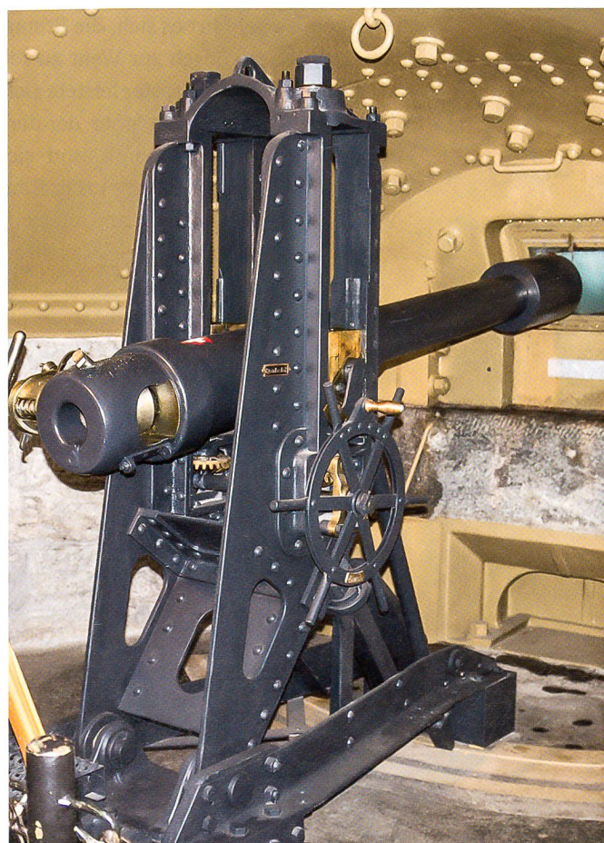
Eine 8,4-cm-Ringrohrkanone aus dem Jahr 1880.