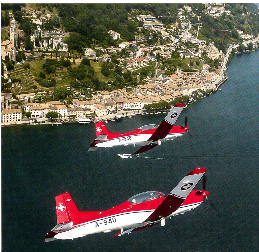
Morcote: Ein Prachtsbild aus einem Band mit vielen gestochen scharfen Bildern.

Hansjörg Bürgi, Verleger, bedankte sich seinerseits für die herausfordernde Aufgabe der Herstellung des Jubiläumsbandes. Er äusserte sich zu den Fotos, zum Layout und zum Papier. Während Teil 1 auf weissem Papier gedruckt wurde, kam bei