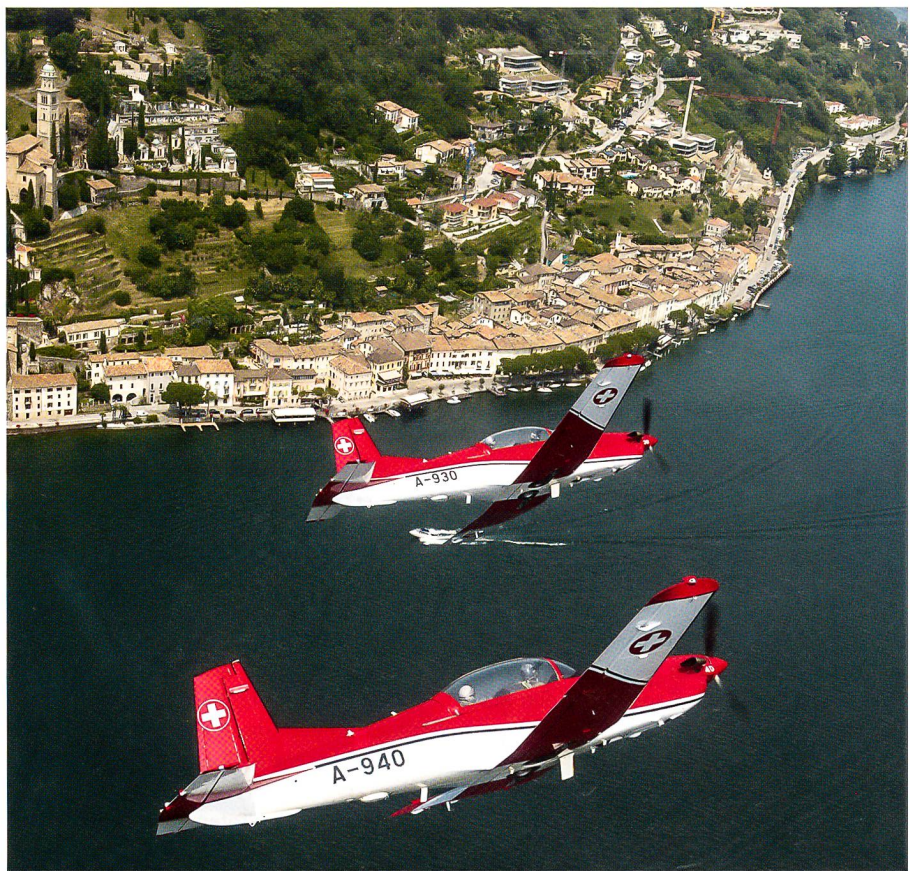
Morcote: Ein Prachtsbild aus einem Band mit vielen gestochen scharfen Bildern.

Hansjörg Bürgi, Verleger, bedankte sich seinerseits für die herausfordernde Aufgabe der Herstellung des Jubiläumsbandes. Er äusserte sich zu den Fotos, zum Layout und zum Papier. Während Teil 1 auf weissem Papier gedruckt wurde, kam bei