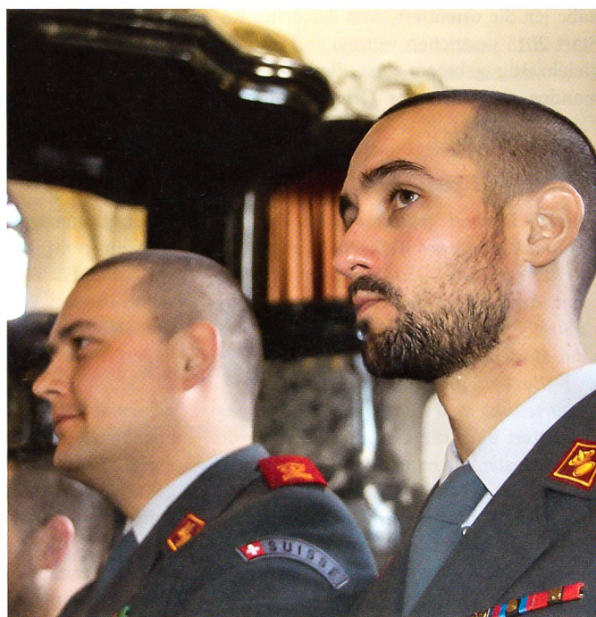
Aufmerksame neue Adjutanten in der schönen Kirche Herisau.