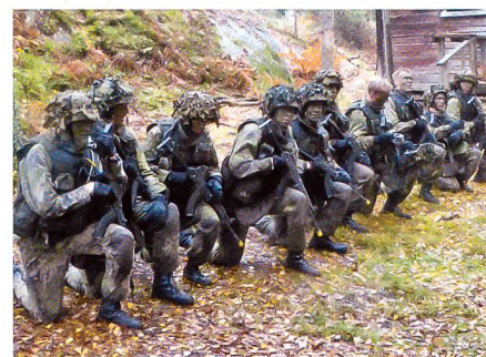
Eine Marines-Gruppe nach dem Angriff.