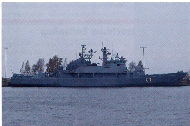
Das finnische Minenkampfschiff (Minenleger) Pohjanmaa 01.