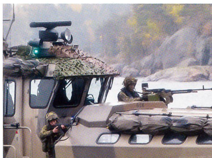
Feuerschutz für die landenden Marines.