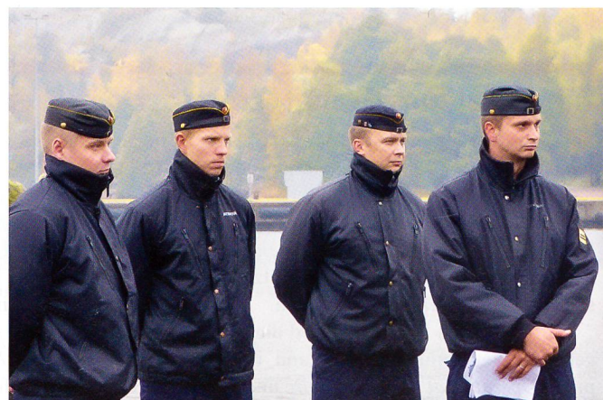
Finnische Offiziere des 7. Raketen Schnellbootgeschwaders.