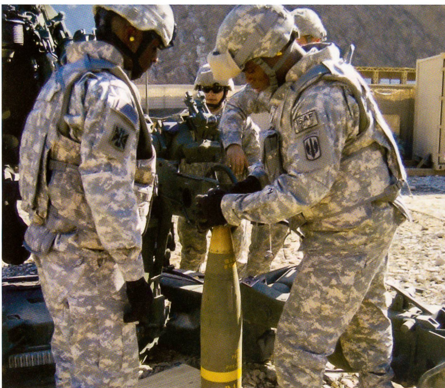
Amerikaner in Afghanistan: Der Tempierer bereitet Excalibur auf den Abschuss vor.

Weil gleichzeitig zur Forderung 1 – höchste Präzision – die Forderung 2 – immense Schussdistanz – trat, mussten die Ingenieure neue Herausforderungen über-