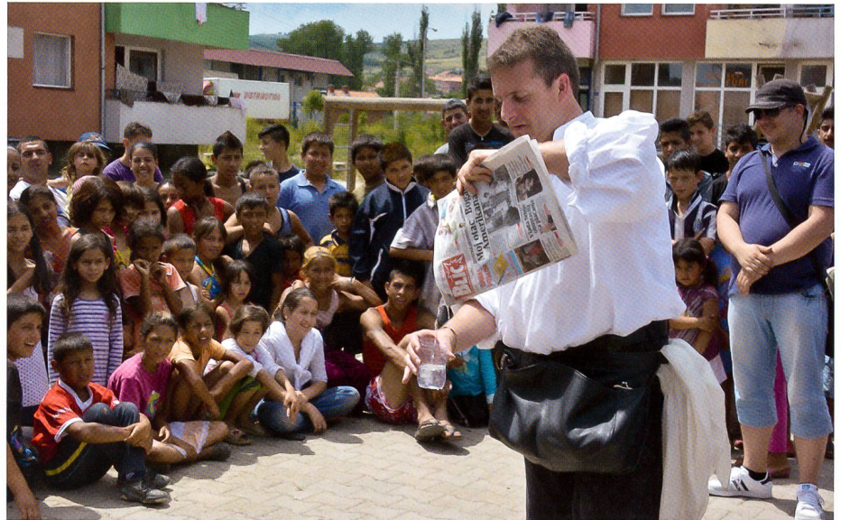
Auftritt im Juni 2013: Roma Mahalla, Mitrovica, Kosovo.