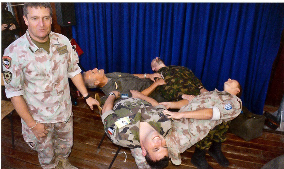
«Die schwebenden Ravellis», kurz bevor der letzte Stuhl weggenommen wird.