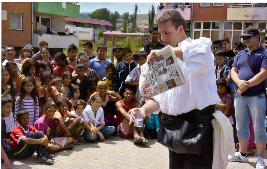
Auftritt im Juni 2013: Roma Mahalla, Mitrovica, Kosovo.