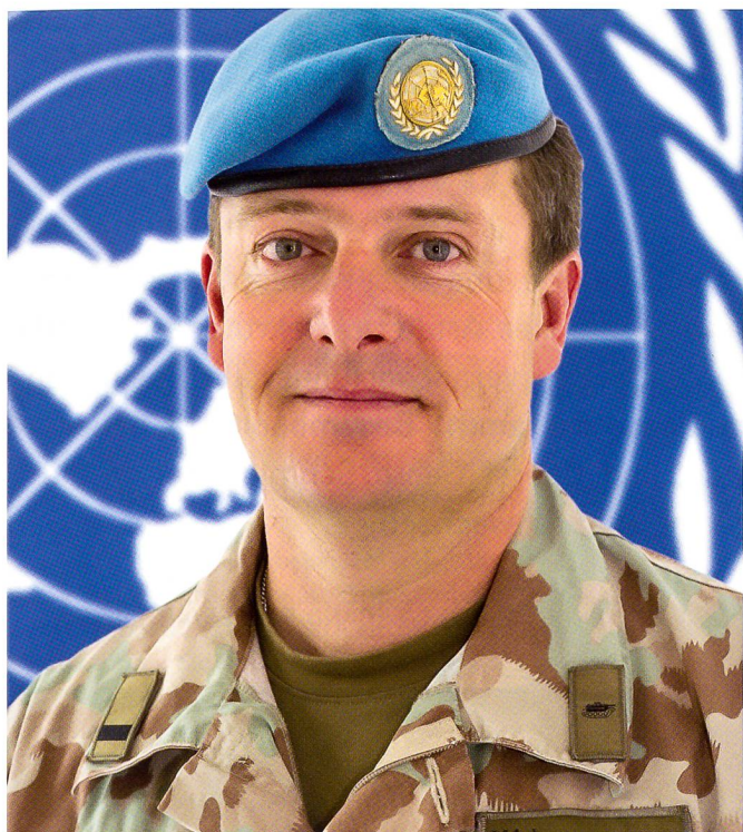
Als UN-Military Observer 9.2011–10.2012, OGG-D (Observer Group Golan, Damascus), hier als Deputy Chief OGG.