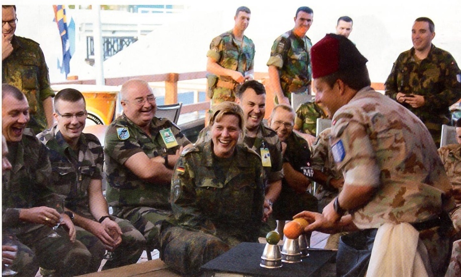
Auftritt im «Swiss House», Camp Filmcity, HQ KFOR, vor Publikum aus der Schweiz, Deutschland, Österreich, Portugal und Frankreich. «Cups & Balls».