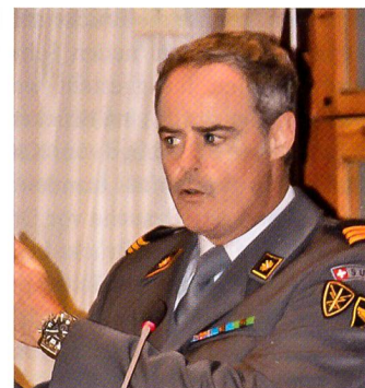
SOG-Vizepräsident Graf: «Brigaden als Kampfverbände.»