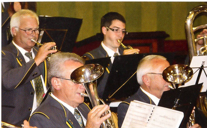
Das Spiel der Kantonspolizei Thurgau in neuer Uniform.