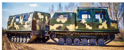
Der Geländetransporter GAZ-3344.

Im vorderen Abteil können fünf und im hinteren Teil zwölf ausgerüstete Soldaten transportiert werden. Ein JAMZ- oder Perkins-Dieselmotor mit 136 kW beschleunigt das Fahrzeug auf bis zu 60 km/h an Land und bis 6 km/h im Wasser. Der GAZ-3344