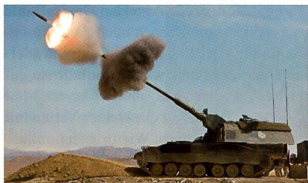
Deutsche PzH2000 in Afghanistan.

Nach der Genehmigung durch das kroatische Parlament werden die Mitte 2013 begonnenen Verhandlungen zur Beschaffung von zwölf Panzerhaubitzen PzH2000 aus