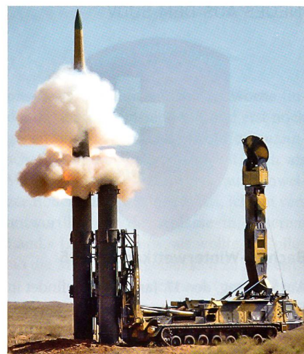
Abschuss einer S-300.

Im vergangenen Sommer gab das Verteidigungsministerium in Moskau der Gratislieferung grünes Licht. Die Flugabwehr-Raketensysteme S-300 sind für die Verteidigung grosser Industrie- und sonstiger Zivil- und Militäranlagen bestimmt und können unter anderem auch ballistische Langstreckenraketen abfangen. Die neuesten Modifikationen sind in der Lage, Ziele