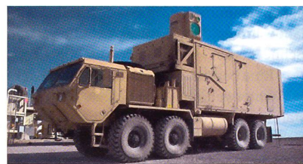
Boeing HEL MD.

Die US Army und Boeing haben den von Boeing entwickelten High Energy Laser Mobile Demonstrator (HEL MD) unter maritimen Bedingungen mit Wind, Regen und Nebel getestet. Dazu war der 10-kW-Laser mit einem voluminösen Unterbau für Feuer-