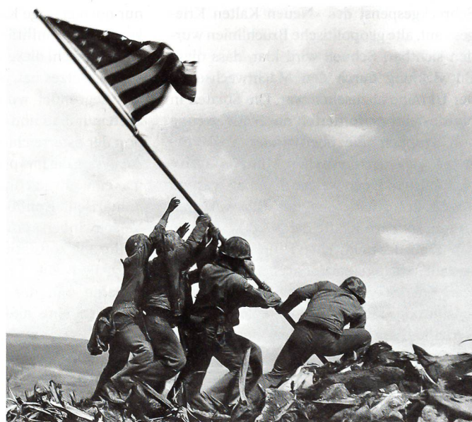
Pazifikkrieg, 23. Februar 1945: Amerikaner hissen auf Iwojima das Sternenbanner. Auch diese Bildikone ist nachgestellt.