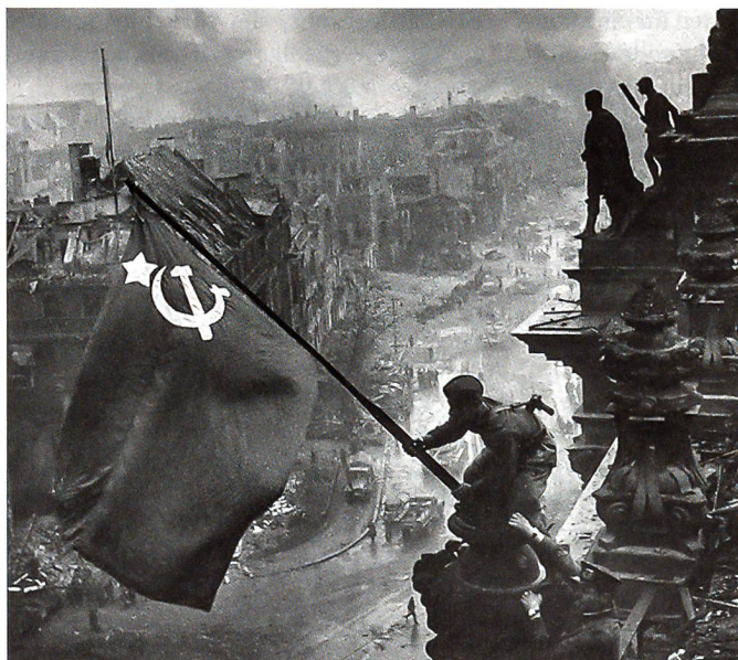
Berlin, 2. Mai 1945: Über dem Reichstag hisst ein Russe die Rote Fahne. Er trug mehrere Uhren, das Bild ist nachgestellt.