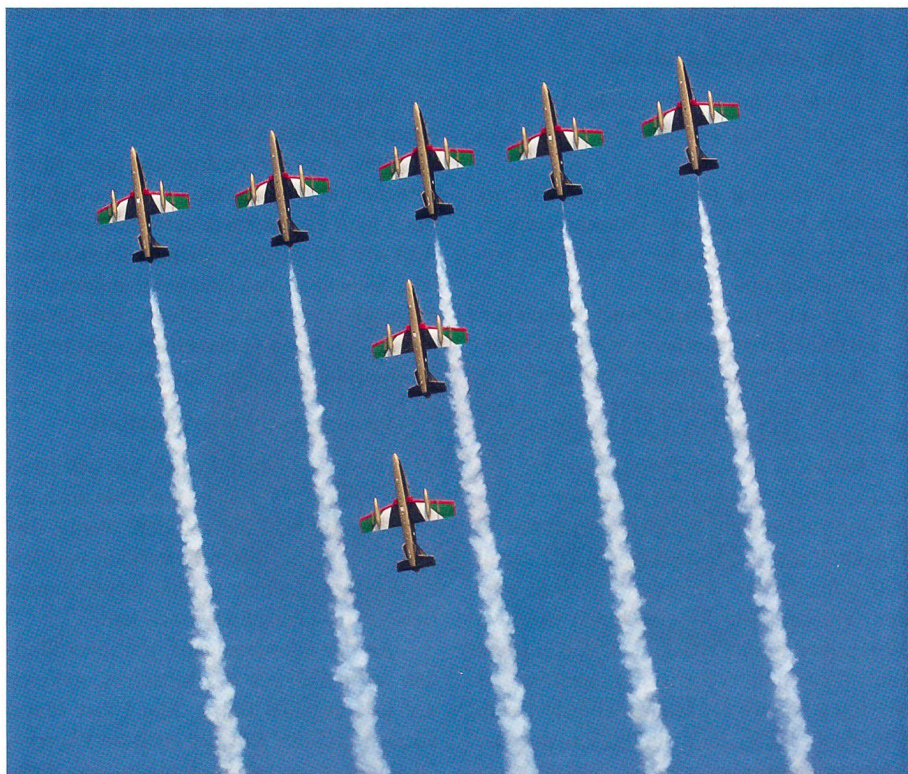
Die Fursan al Imarat, wie sie genau heissen, über Payerne: erstmals in der Schweiz.