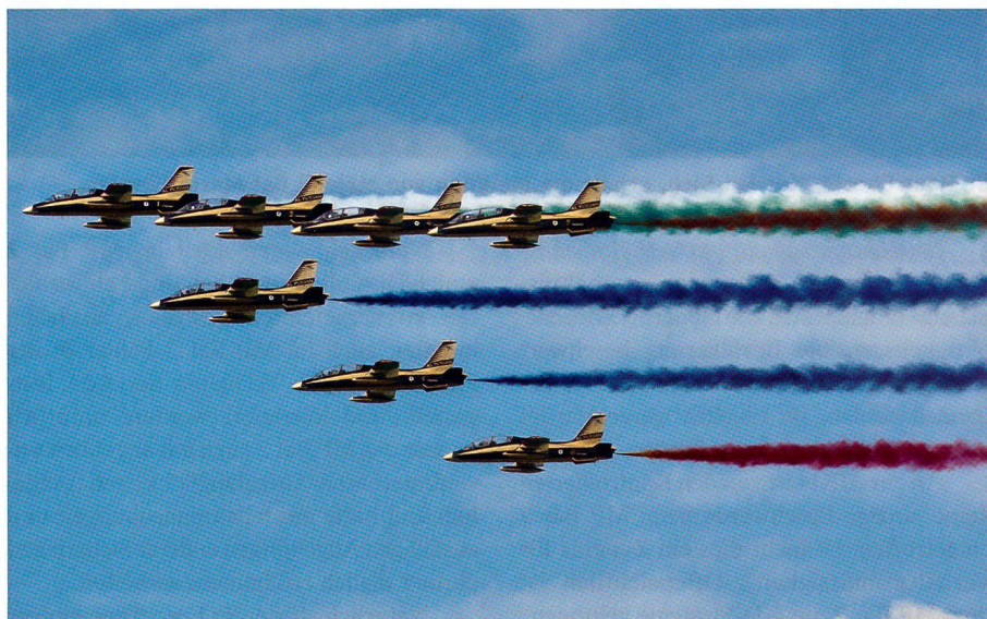
Die sieben Ritter der Vereinigten Arabischen Emirate mit den Landesfarben.

Erstmals am Schweizer Himmel flogen an der AIR14 die sieben schwarz-goldenen Jets von Al Fursan. Die Kunstflugstaffel der Vereinigten Arabischen Emirate ist eine der jüngsten Formationen in der Welt der Airshows.