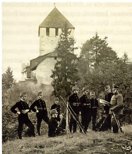
Posten vor dem Turm der Burg Hohenklingen oberhalb von Stein am Rhein.

Und vielleicht die grösste Angst der Entscheidungsträger: die Reaktion der öffentlichen respektive der veröffentlichten Meinung sollte nicht in den Krieg eingetreten werden, denn eines wollten sich viele Entscheidungsträger in der veröffentlichten Meinung nicht nachsagen lassen, Schwächlinge zu sein. Die Angst führte also die Entscheidungsträger letztlich dazu, den Krieg