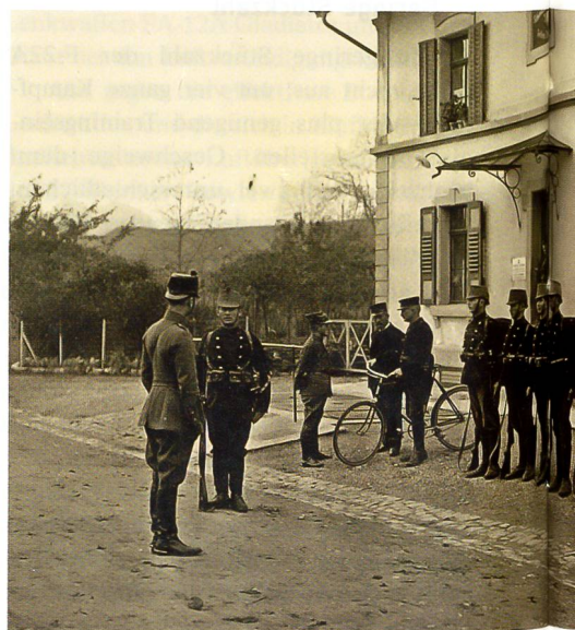
Antreten und Meldung auf dem Grenzwachtposten Barz

Immer mehr fixierte sich in der Folge die österreichische Politik auf den Balkan, insbesondere auf Serbien. Der österreichische Generalstabschef Conrad von Hötzendorf forderte seit Jahren den Präventivkrieg gegen Serbien. Das Attentat von Sarajewo wurde ihm zum Katalysator, seinen Krieg zu bekommen, zumal mit der Ermordung des Thronfolgers Erzherzog Franz Ferdinand genau die Person nicht mehr auf