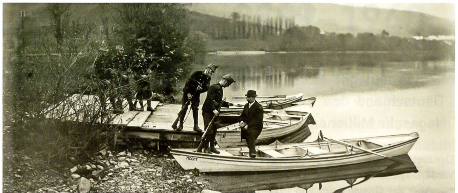
Grenzkontrolle am Rhein auf der Thurgauer Seite beim ehemaligen Kloster Paradies.

Anders als das Gebiet zum Jura wurde der Kanton Schaffhausen nicht in ein grösseres militärisches Dispositiv einbezogen. Was aber von grosser Bedeutung blieb, war