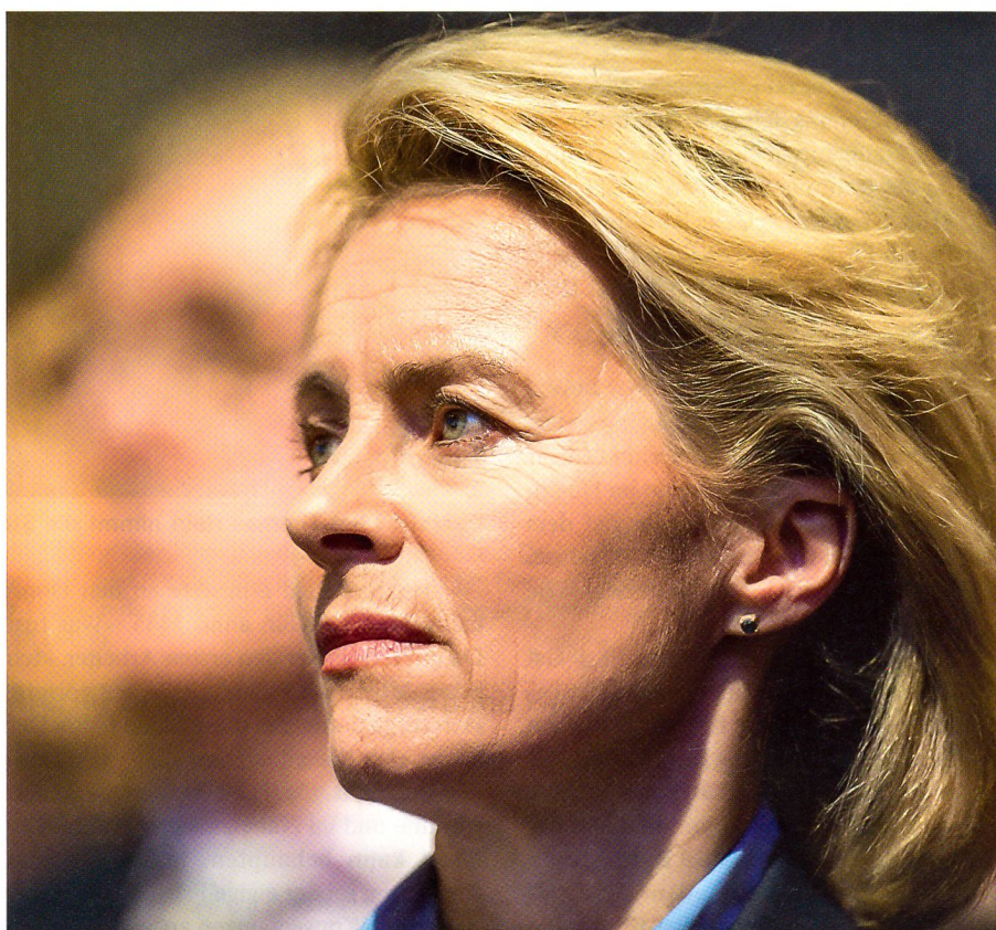
Verteidigungsministerin Ursula von der Leyen, im Amt seit dem 17. Dezember 2013.