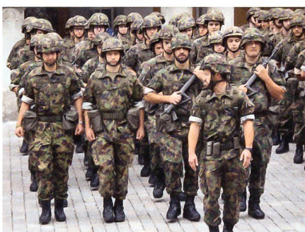
Der Aufmarsch auf dem Goldenen Boden.