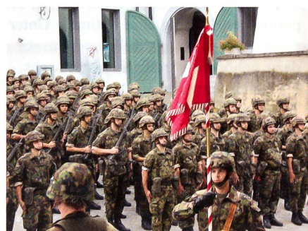
Ein stolzer Fähnrich im Hof zu Wil.