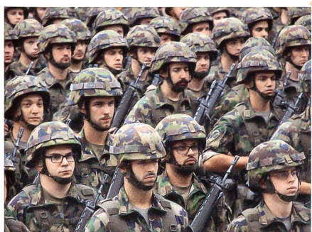
Das Ristl Bat 32: kernig und kompetent.