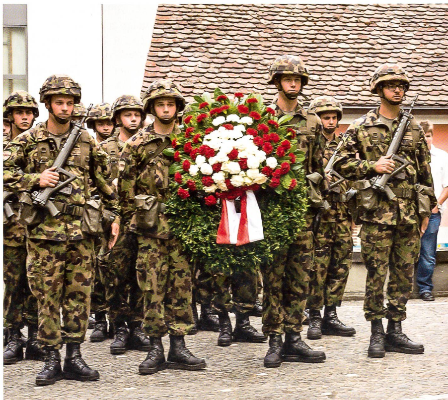
Auf dem Herrenacker zu Schaffhausen: Der Ehrenzug mit dem Kranz zum Gedenken.

Der heutige Tag erinnert uns daran, wie zerbrechlich, ja gar flüchtig Frieden und Freiheit sind! Dass Frieden und Freiheit nie umsonst zu haben sind. Dass wir uns immer darum bemühen müssen, dafür zu sorgen haben und uns für Friede und Freiheit einsetzen müssen. Notfalls auch bereit sein müssen, dafür das Leben einzusetzen.