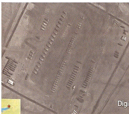
Aufmarsch eines Mot-Schützen-Regimen- tes mit Panzerfahrzeugen bei Kuzminka.