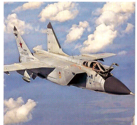
MiG-31 gehören zum eisernen Bestand der starken russischen Luftstreitkräfte.