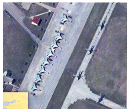
Su-27/30-Jets (NATO-Code Flanker) auf dem Stützpunkt Primorko-Akhtarsk.