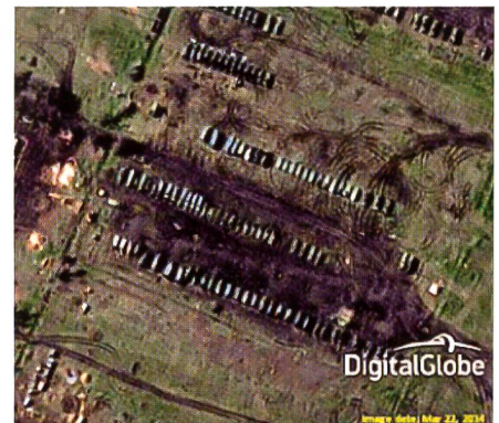
Aufmarsch russischer Sonderstreitkräfte (Speznas, eventuell Luftlande) bei Yeysk.