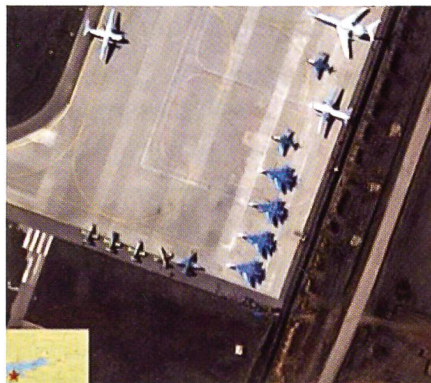
Su-33-Jets an der Grenze. Wir bitten um Verständnis für die Qualität der Bilder!

Der britische Brigadegeneral Gary Deakin führt im Shape (Supreme Headquar- ters Allied Powers Europe) im belgischen Casteau bei Mons das Krisenoperations- und Managementzentrum der NATO. Vorher befehligte er das 1. Bataillon des Duke of Lancaster's Regiment.