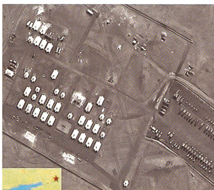
Artilleriebataillon bei Novochockassk (Russland nennt auch Art Bataillon).