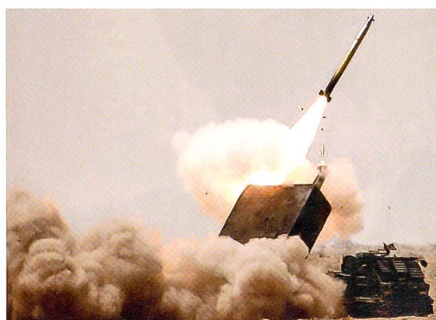
GB-Artillerie: GMRLS, 227 mm, 70 km. Guided Multiple Launch Rocket System.