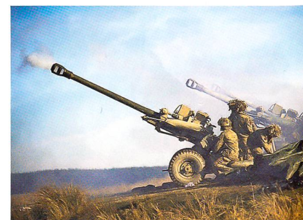
GB: Light Gun, 105 mm, Exportschlager, 8 Schuss/Minute, 20 km, hier ungetarnt.