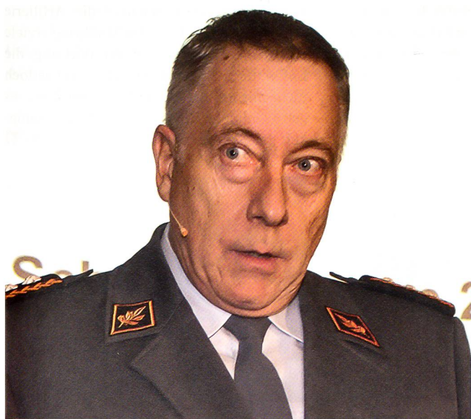
Für sein kompetentes Referat erhielt der CdA viel Applaus.