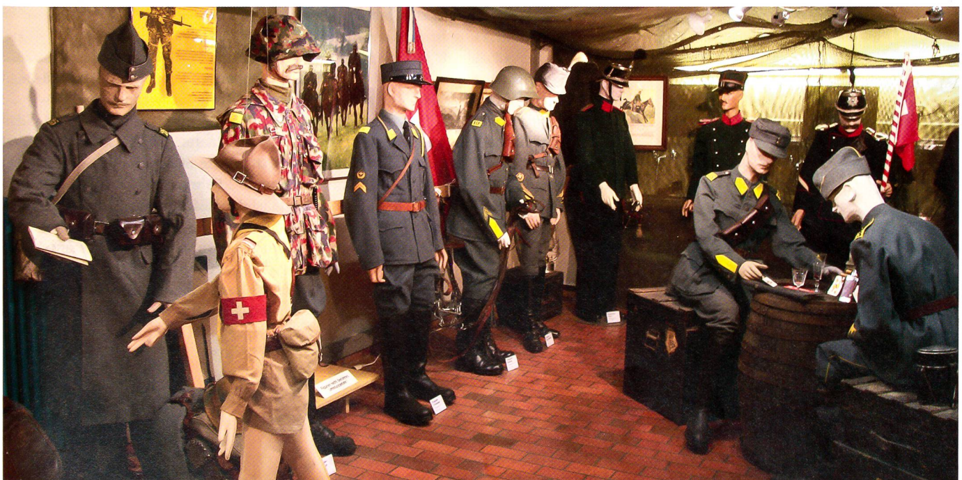
Das Schweizerische Unteroffiziersmuseum verfügt über eine reichhaltige Uniformensammlung.