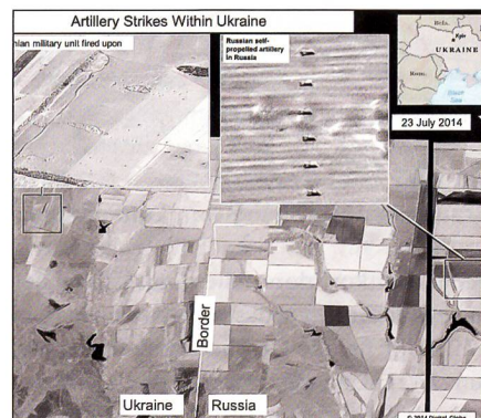
Nochmals Einschläge in der Ukraine und rechts die sechs Raketenwerfer einer russischen MLRS-Batterie in Russland.