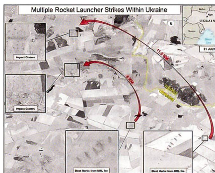
Rote Pfeile: nach amerikanischer Lesart die Flugbahnen der russischen MLRS-Mehrfachraketenwerfer (6 und 11 km).