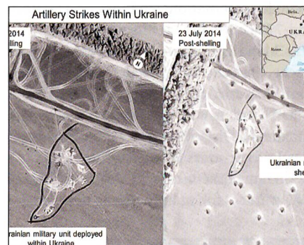
Vorher: Links ukrainische Stellung am 20. Juli vor dem Beschuss. Nachher: Rechts 23. Juli mit Raketeneinschlägen.