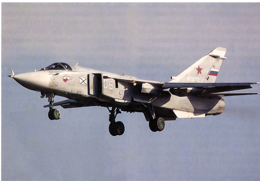
Die Suchoi-24 hatte ihren Erstflug 1967. Die robuste Maschine dient der Aufklärung.