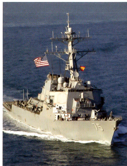
Der amerikanische Raketen-Zerstörer Donald Cook (DDG-75) ist mit dem Warn- und Feuerleitsystem Aegis ausgerüstet. Eine russische Suchoi-24 soll das System im Schwarzen Meer gestört haben.